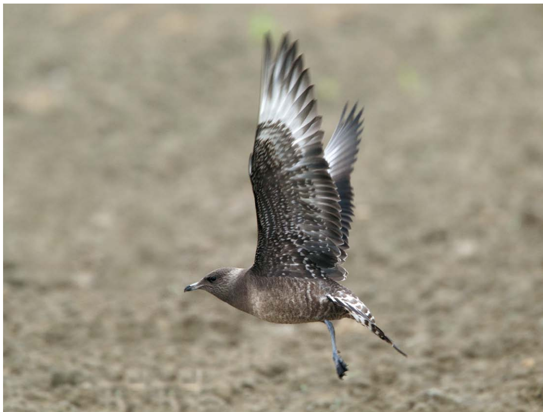
■ Labbo codalunga ( Stercorarius longicaudus ), San Gaudenzio (PV), ottobre 2014. In questa immagine sono evidenti la coda lunga e stretta e la banda chiara su petto e nuca, tipica degli esemplari di forma intermedia. Nel complesso il piumaggio appare privo di toni caldi, carattere peculiare dei giovani di questa specie.

almeno 600 metri e questi, dopo poco, sparisce alla nostra vista dietro una cortina di alberi. Subito ci interroghiamo sull'identità dell'uccello e, malgrado non avessimo potuto capire granché data la distanza e la brevità dell'osservazione, io azzardo che possa trattarsi di uno Stercorario mezzano ( Stercorarius pomarinus ), ma con moltissimi punti interrogativi. Speranzosi che l'uccello si palesi di nuovo, restiamo in allerta e, dopo circa dieci minuti, l'oggetto misterioso riappare in volo, sempre lontano, ma per un periodo più lungo. Con previdenza avevamo piazzato i cannocchiali e riusciamo a osservare dei particolari non visibili con i soli binocoli. Notiamo così che lo stercoraride, grosso modo della dimensione di un Gabbiano comune ( Chroicocephalus ridibundus ), non ha evidenti flash bianchi sulle ali, il becco è minuto e la coda ha le timoniere centrali significativamente lunghe; vediamo altresì il sottocoda bianco con barrature scure. A questo punto ci rendiamo conto che, molto probabilmente, ci troviamo di fronte a un giovane Labbo codalunga ( S. longicaudus ).