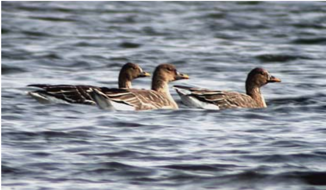
Oche granaiole della taiga, Laghetto del Frassino (BS0105), gennaio 2003