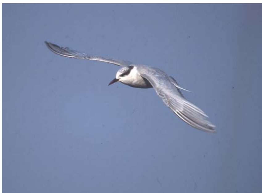
Mignattino piombato, Basso Lago di Garda (BS0103), gennaio 2003